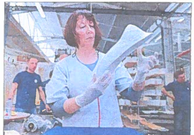
C'est l'heure du polissage et de la vérification de l'émaillage.

SAVOIR-FAIRE ■ Les Porcelaines de La Fabrique ont fabriqué des chaussures conçues par Christian Couty