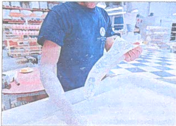
Passage à l'émaillage. Un bon bain tout blanc.