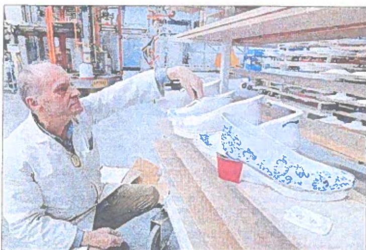
Les différents prototypes qui servent à finaliser la chaussure en porcelaine.